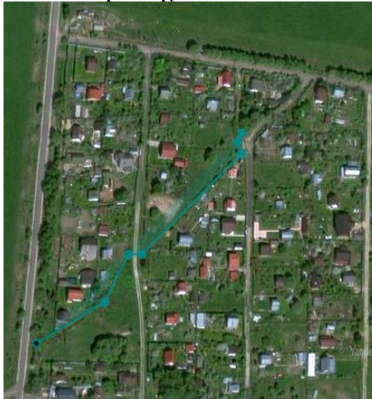
Рис. 1 схема прокладки отводящего трубопровода и ливневой траншеи.